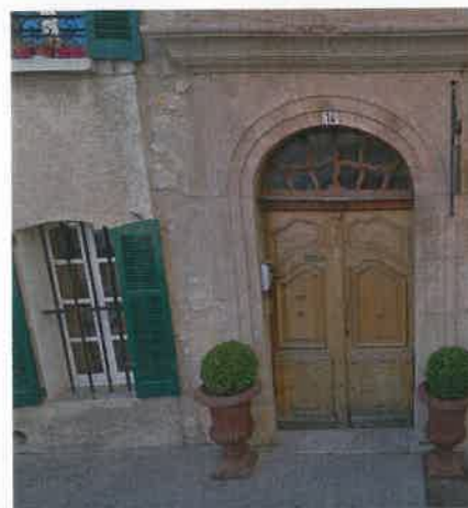
14 RUE DE L'ÉGLISE: Bak denne døren åpner det seg en oase av en bakgård med cafe, basseng og petanquebane.