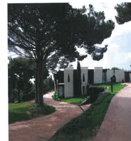
SKULPTURELT: Ikke mange rette vinkler og utstrakt bruk av edelt treverk, skulpturer og kunst preger Villa Sabine. Og panoramautsikten.