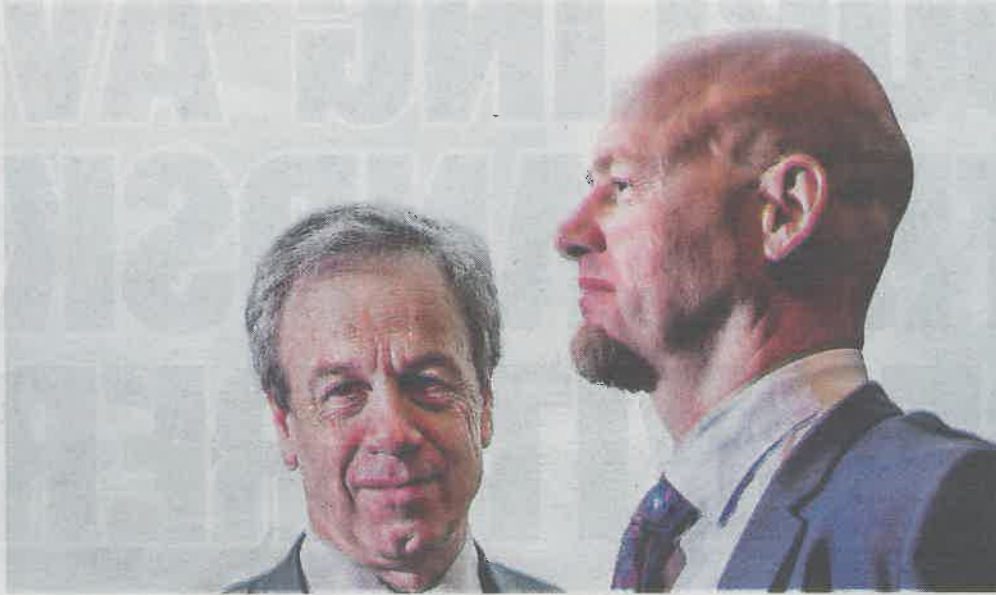
OLJEFORMUEN: Den forvaltes i dollar. Det er en fordel for den norske økonomien.