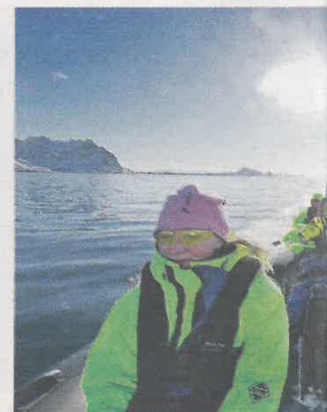
FERIE PÅ NORSK: Ferie i Norge vil bli