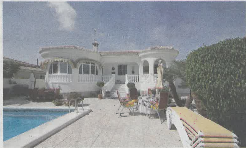
DYRT FERIEHUS: Å kjøpe feriehus i utlandet vil bli en del dyrere på grunn av kronekursen.