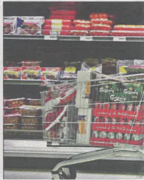
DYR OG BILLIG MAT: Norsk mat vil bli