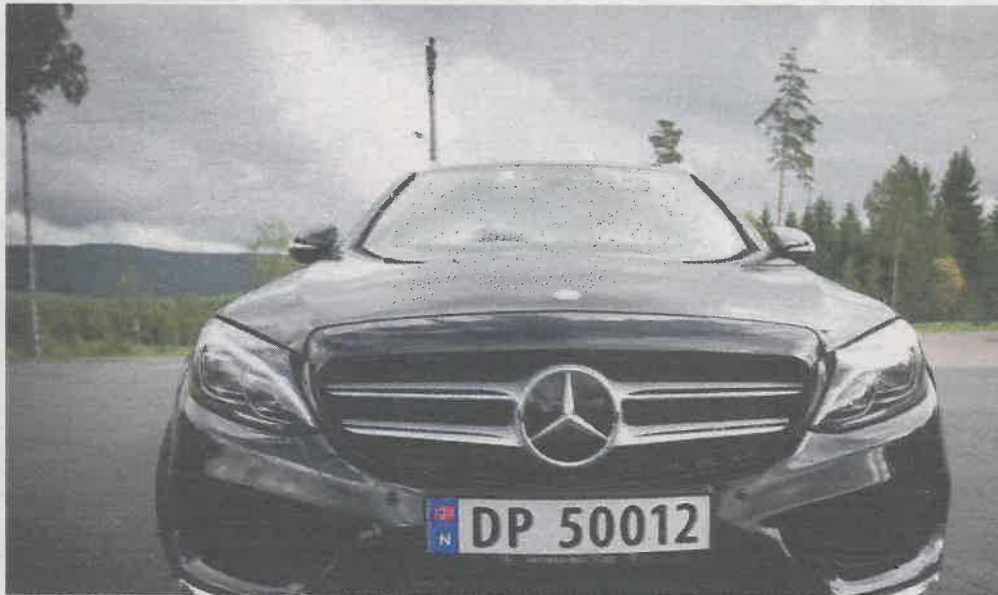
DYRERE BILER: Drømmer du om ny bil, må du regne med å punge ut mer fremover.

Skal du til USA på ferie i år, tilsier dollarkursen at