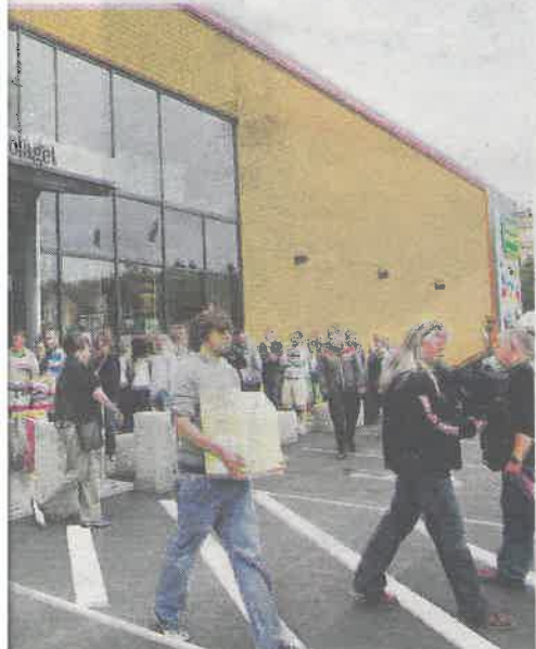
på den andre siden av grensen, vil bli skuffet.