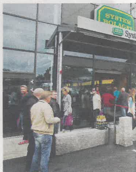
HARRY-DYRT: De som er vant til billighandel