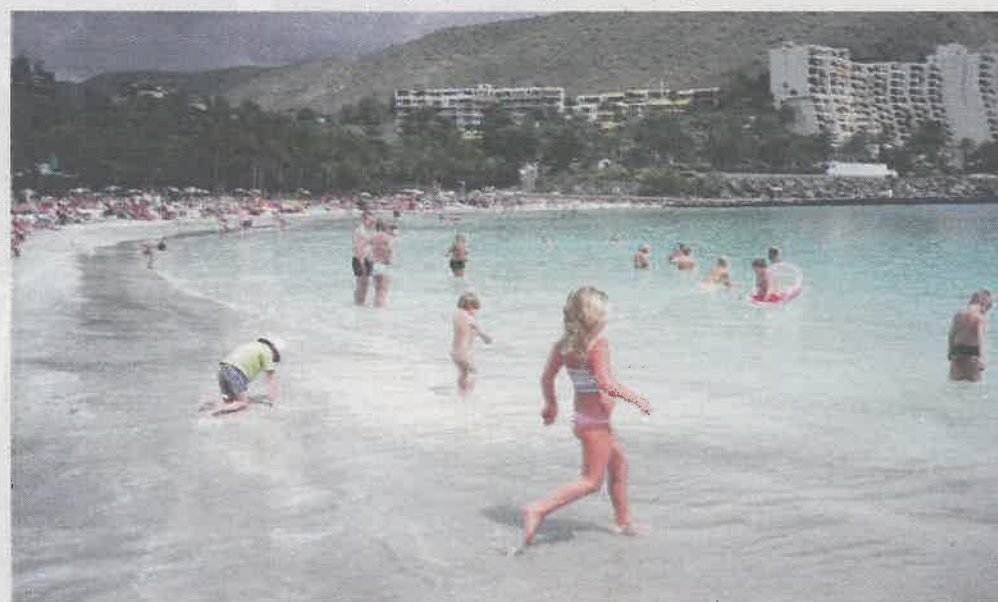
DYRERE I SYDEN: Drømmeferien i varmere strøk vil nok bli en hel del dyrere i sommer.