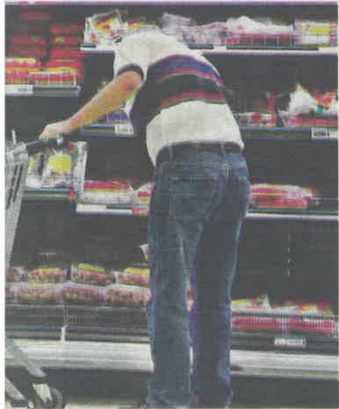
billigere. Importmat vil kunne bli dyrere.