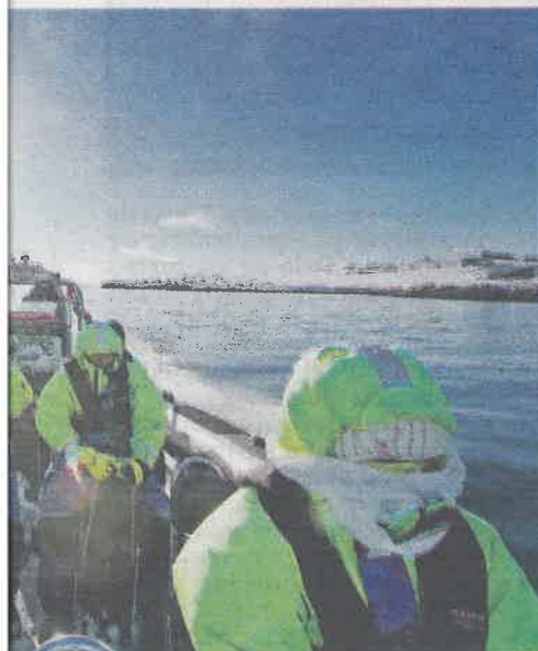
billigere, og det vil glede norsk reiselivsbransjen.