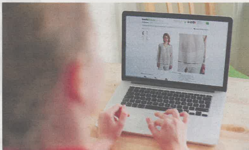
MINDRE ATTRAKTIVT: Det kan bli mindre attraktivt å handle gjennom nettbutikken fremover.