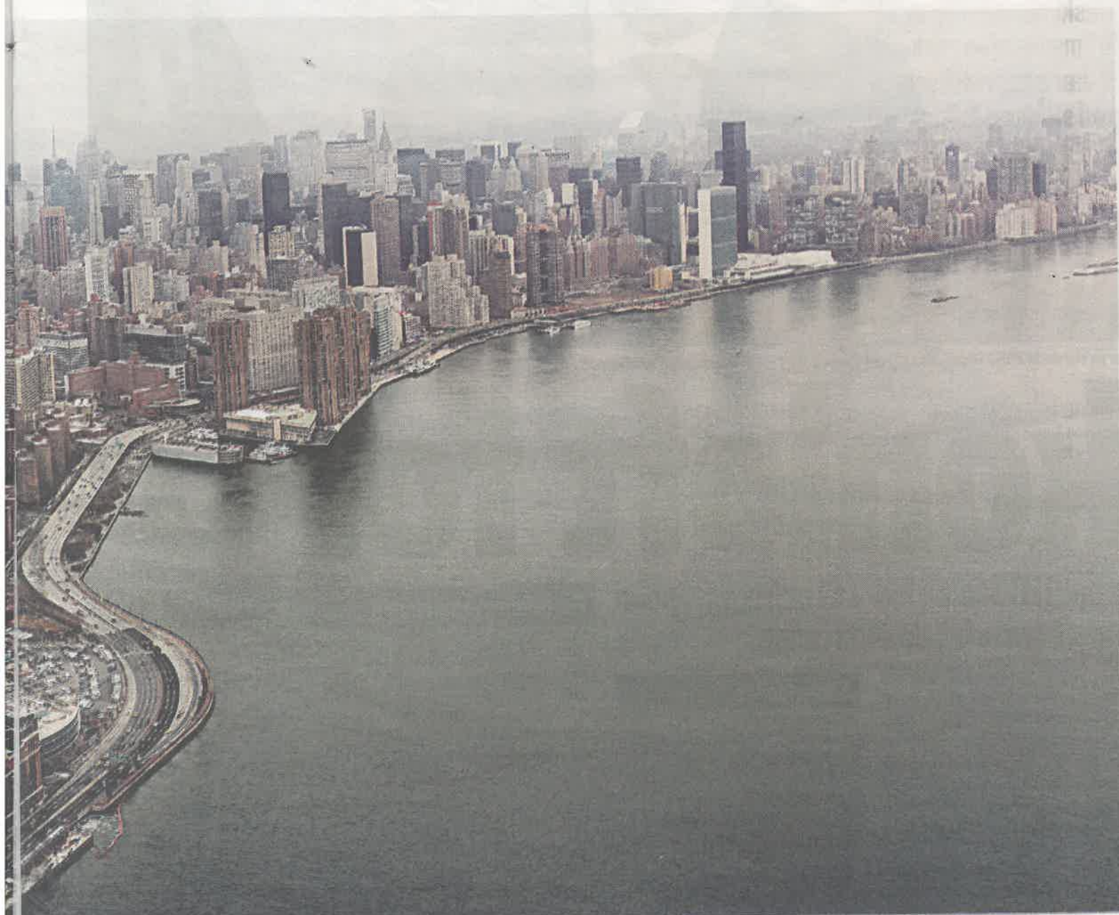
Men skatte- og trygderegler er likevel mer kompliserte for land utenfor EØS. Her fra New York.